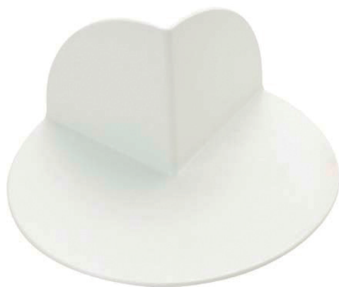
EETPO Ángulo exterior

Fabricado en TPO, Poliolefina universal de color blanco, para ser compatible con la mayoría de membranas producidas con Poliolefina. La zona de unión es lisa para conseguir una unión de calidad con la membrana impermeabilizante.