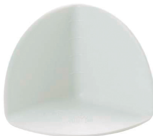
EITPO Ángulo interior